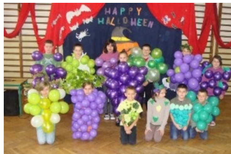
Dzień owoca i warzywa