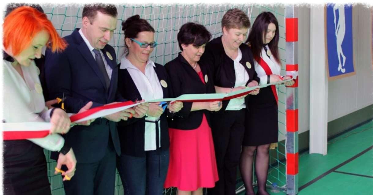
Moment przecięcia wstęgi