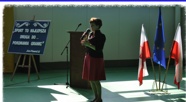
Wystąpienie p. Minister