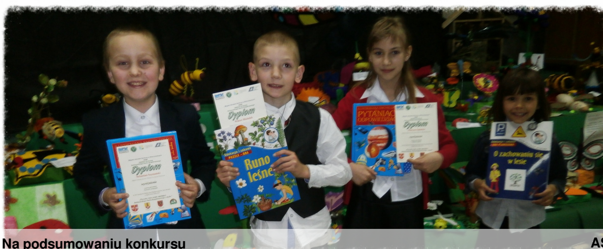
Na podsumowaniu konkursu