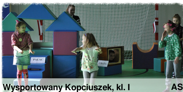
Wysportowany Kopciuszek, kl. I