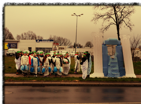
Kibicujemy w czasie maratonu