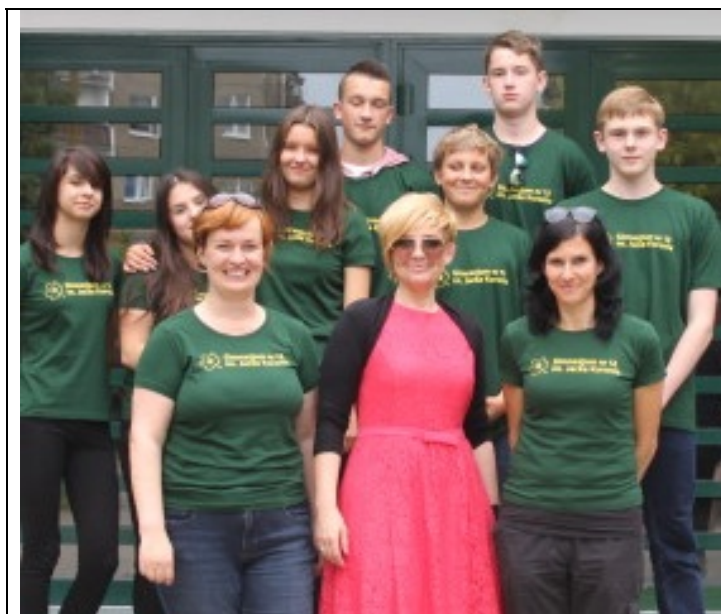
Pani Dyrektor z grupą uczniów i nauczycielkami BB