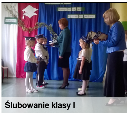
Ślubowanie klasy I

Najczęściej najlepszymi prezentami okazują się te wykonane własnoręcznie. W dzisiejszym numerze pokażę wam jak zrobić prosty ale ciekawy upominek.