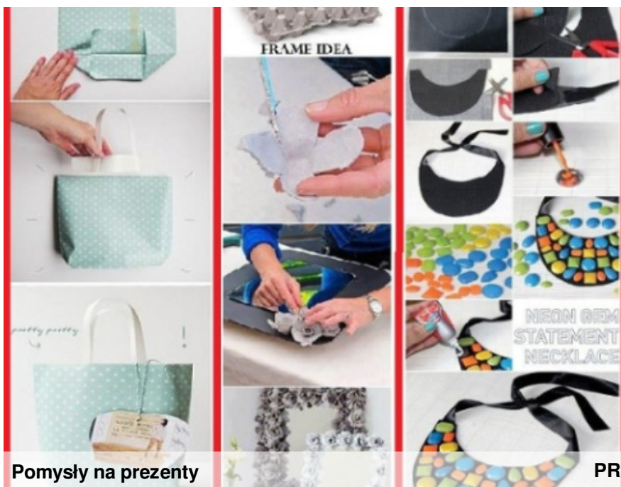
Pomysły na prezenty

Na przedstawionym zdjęciu możecie zobaczyć jak zrobić fajną torbę, ramkę na zdjęcie z wyłuczanki po jajkach oraz piękny naszyjnik.