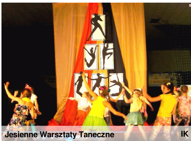
Jesienne Warsztaty Taneczne

Jeśli jednak spędzacie ferie w Kołobrzegu, zapraszamy do naszego klubu! Będzie kreatywnie i wesoło, u nas ferie od 1 do 14 lutego 2016r.