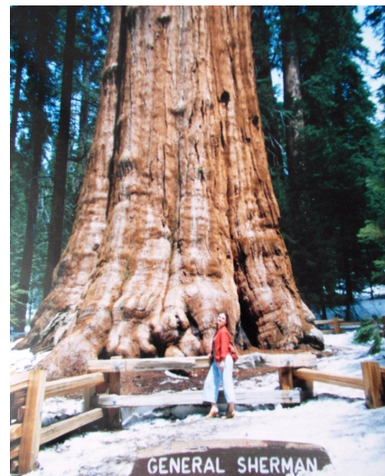
Sequoia National Park red.

Sekwoje pod choinkę? Brzmi co najmniej dziwnie. Sekwoje i mamutowce olbrzymie to przecież największe drzewa na świecie. Można je podziwiać w Sequoia National Park w USA - drugim najstarszym parku narodowym w tym kraju, założonym w górach Sierra Nevada w Kalifornii. Największym drzewem jest w nim "Generał Sherman Tree" (zdjęcie obok). Ma ono 83,8 m wysokości, 7,7 m średnicy pnia, a jego wiek to 2300 - 2700 lat. Imponujące rozmiary i wiek! Pod żadną choinką na pewno się nie zmieści, lecz wycieczka do USA i do Parku Sekwoi mogłaby być niezłym prezentem dla całej rodziny. Wizyta w Parku Sekwoi to też gratka dla młodzieży, która co roku bierze udział w programach wymiany szkolnej i kulturowej do USA. Pozwalają one uczniom w wieku 15-19 lat na wyjazd do amerykańskich szkół, naukę języka angielskiego i innych przedmiotów (jeśli jest to półroczna lub roczna wymiana) i wycieczki do najciekawszych miast, parków i innych miejsc w USA. W Edu Clubie prowadzimy taką wymianę, warto pomyśleć o tym już teraz, by w wakacje lub w kolejnym roku szkolnym mieć okazję poznać Amerykę osobiście, nie tylko w internecie i przewodnikach!