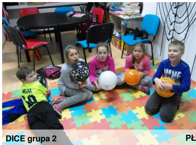
DICE grupa 2

Ciekawostka: Jak każdy język, język angielski też się cały czas rozwija. W związku ze zmianą trybu życia na coraz bardziej siedzący (i to przed komputerem, już coraz rzadziej telewizorem!) powstał nowy idiom: desk potato ! Ziemniak został, ale tym razem nasz leniwy ziemniak siedzi przy biurku, przed komputerem, a nie przed telewizorem, jak 'couch potato' !