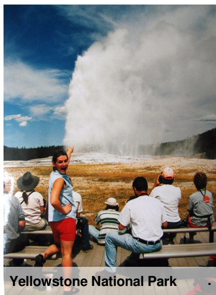
Yellowstone National Park

Najstarszym parkiem narodowym świata jest Park Yellowstone w USA. Od kiedy po raz pierwszy, jako dziecko, zobaczyłam w telewizji gejzery, góry, kolorowe jeziora i inne cuda tego parku, był on na mojej liście miejsc do zwiedzenia. Podobno mieszka tam Miś Yogi. Od marzeń do działań!