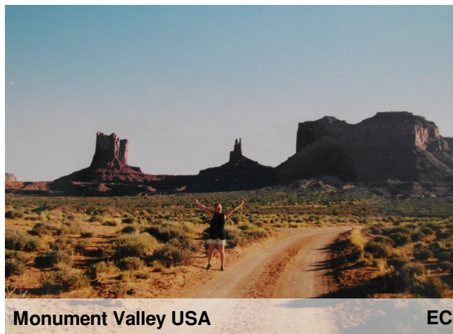
Monument Valley USA