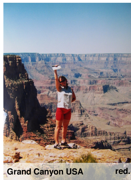
Grand Canyon USA red.

Znajomość angielskiego bardzo mi się przydała. Warto było czekać i nie rezygnować z marzeń. Kilka lat temu udało mi się zwiedzić ten park. Co prawda Misia Yogi nie spotkałam, lecz w parku widziałam wiele innych zwierząt – bizona, łosia, jelenie itp. Niektóre wchodziły na drogę i blokowały ją, musieliśmy czekać, aż zjedzą. Była więc okazja na fotki i obserwacje! W parku było mnóstwo kolorowych jezior, gorących źródeł, wodospadów, pięknych widoków. Na koniec zostawiliśmy sobie jedną z superatrakcji parku Yellowstone - gejzery. Jest ich tam całe mnóstwo. Jeden z największych i najwyższych eksplodujących gejzerów w parku i na świecie to "Stary Wierny", czyli Old Faithfull. Wybucha on co ok. 1,5 godziny, jak w zegarku. Zaczekaliśmy na ten niezwykły pokaz. Efekt widać na zdjęciu! Zachęcamy Was, byście też zwiedzili Yellowstone Park. Wspaniałe miejsca czekają.