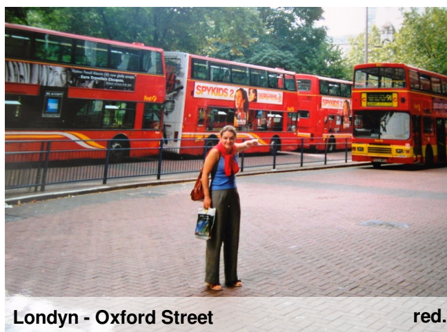
Londyn - Oxford Street