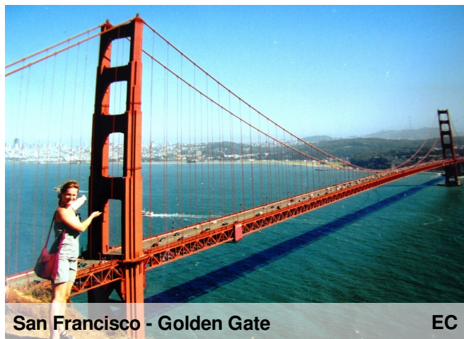
San Francisco - Golden Gate