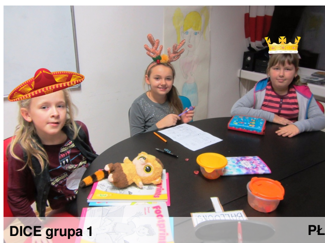
DICE grupa 1