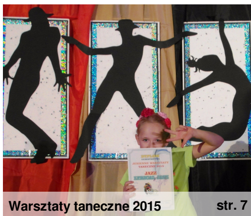
Warsztaty taneczne 2015

Jesienne Warsztaty Tańca Jazz i Lyrical Jazz w Kołobrzegu z udziałem Edu Clubu