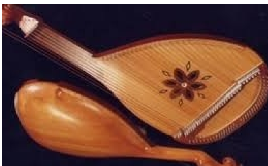
Bandura - ukraiński instrument