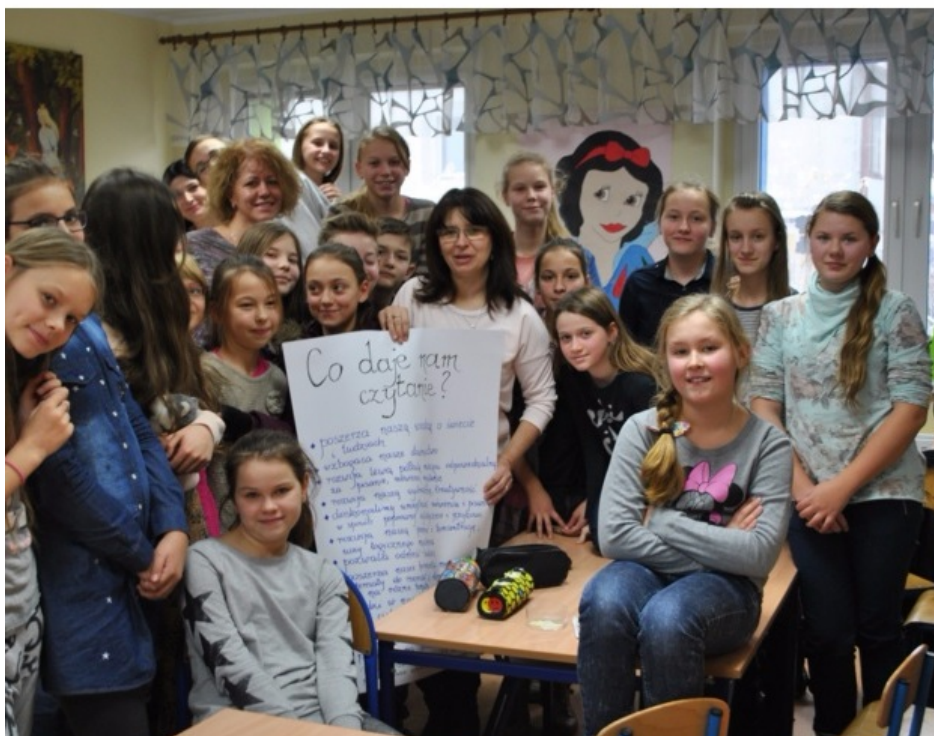
Warsztaty "Książka moich marzeń"