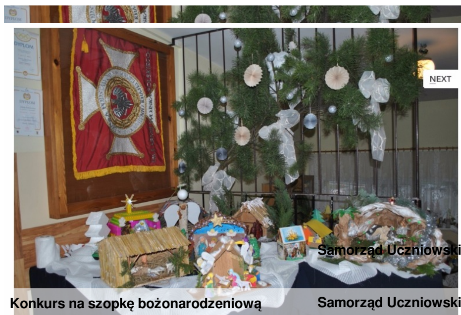
Konkurs na szopkę bożonarodzeniową