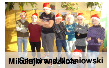
Mikołajki w szkole

Mikołajki to wyjątkowy dla nas dzień. Przeprowadziliśmy akcję „Szkoła pełna Mikołajów”. Każdy mógł tego dnia przeobrazić się w Mikołaja. Było kolorowo, ponieważ wszędzie można było zobaczyć czerwone czapeczki.