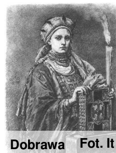
Dobrawa Fot. It

Pierwszy wywiad Dobrawy udzielony naszej Redakcji 28 lat temu. Co nas czeka po śmierci Książęcej pary ?