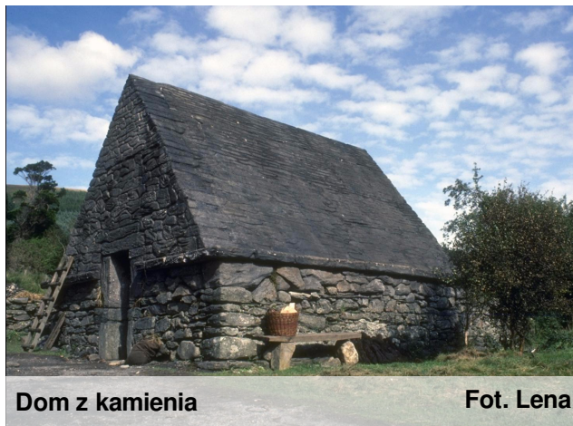
Dom z kamienia

Coraz częściej można zaobserwować pojawianie się domów wznoszonych nie z drewna lecz z kamienia. Czy oznaczałoby to wyparcie architektury drewnianoziemnej? Zdecydowanie nie lecz polecamy wznoszenie budowli z kamienia, gdyż jest to sposób na trwalszy i solidniejszy dom.