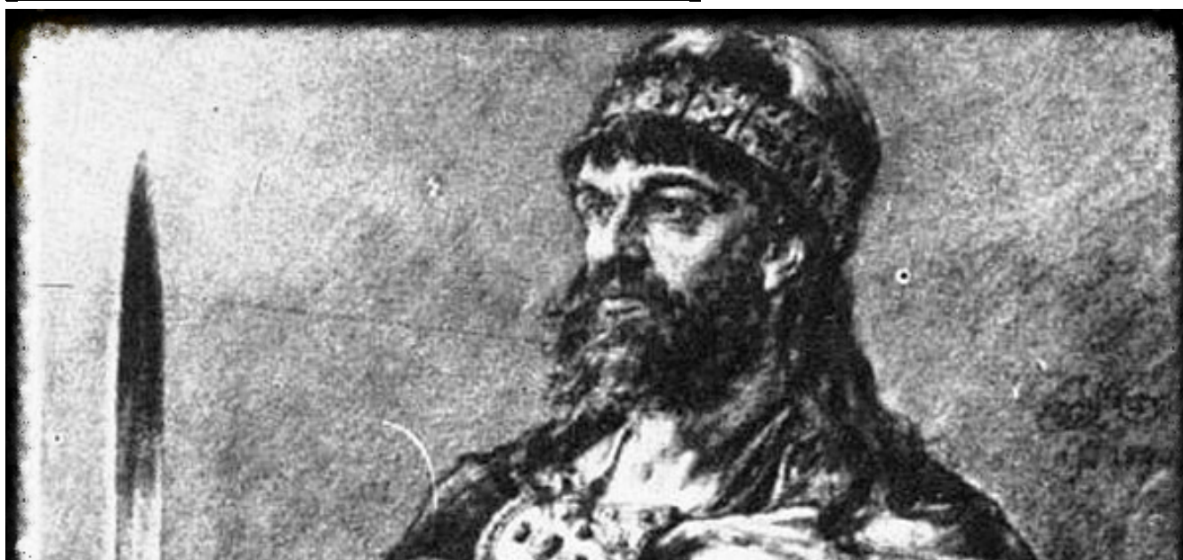
Mieszko I Książę Polski

Polacy w żałobie ! Co z nami teraz będzie ? Czy syn Mieszka sprosta wyzwaniom ?