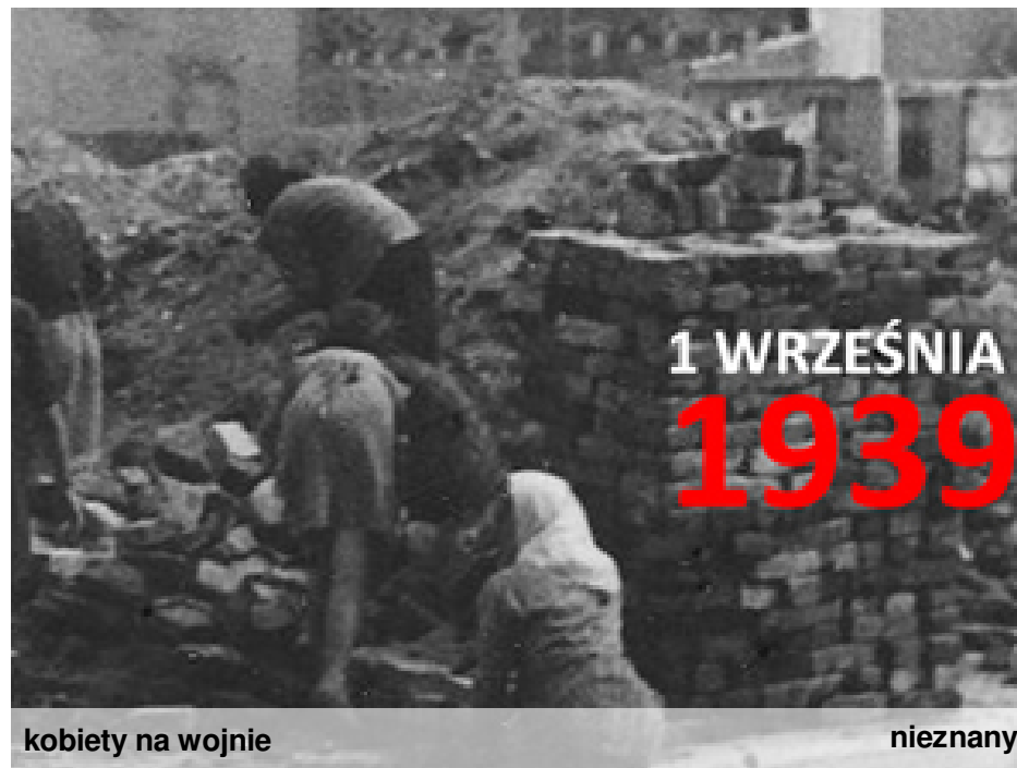
kobiety na wojnie