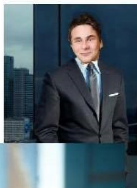
J A K U B