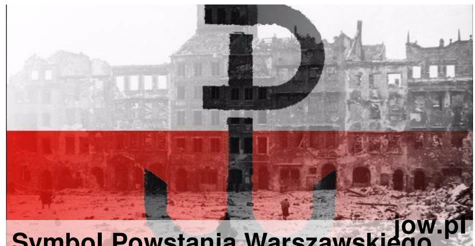
Symbol Powstania Warszawskiego