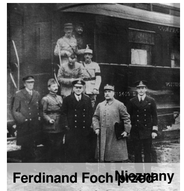
Ferdinand Foch Nieznany

Co za zaskoczenie! Zapraszamy na stronę 3, gdzie opisane są szczegóły i niezwykle następstwa tego wydarzenia. Co to oznacza dla Polski?