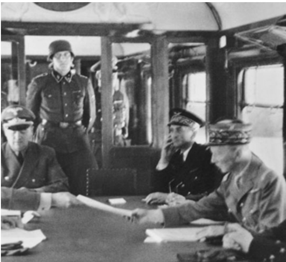
podpis w wagonie