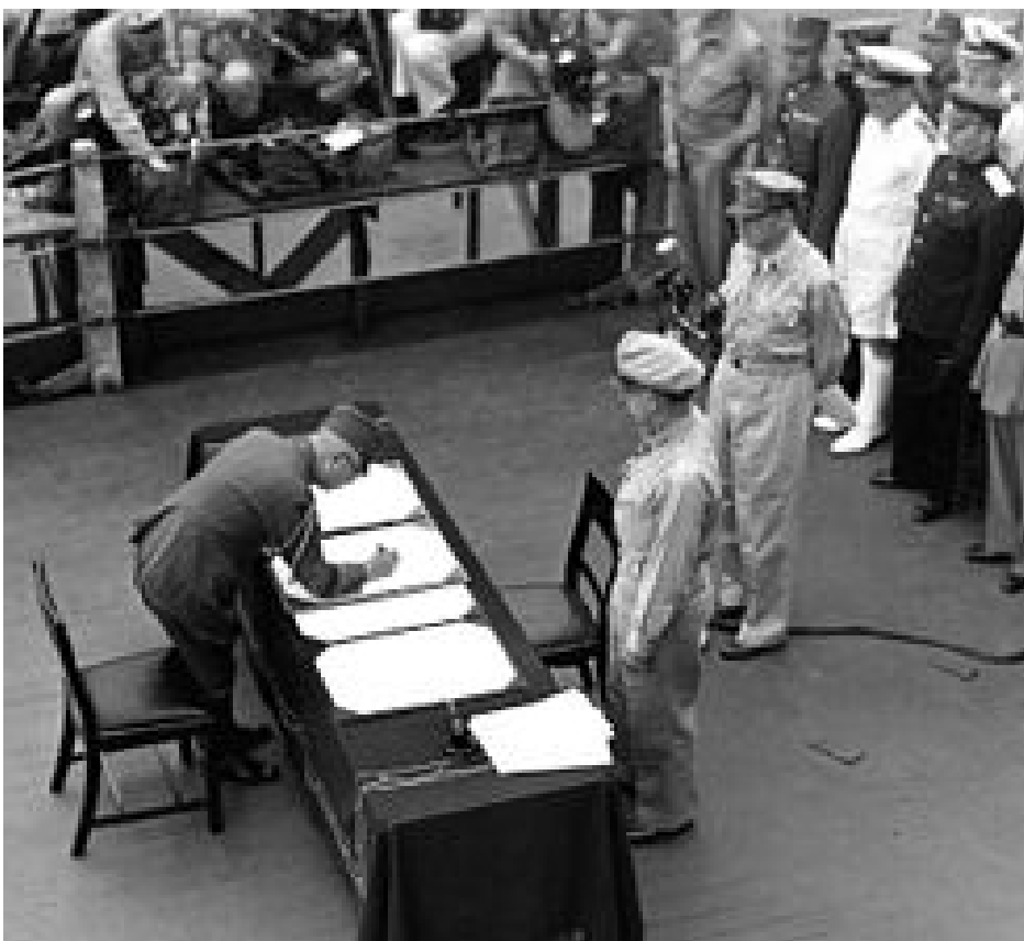
Yoshijirō Umezu podpisuje akt kapitulacji