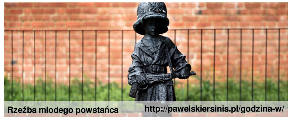
Rzeźba młodego powstańca