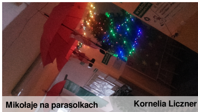
Mikołaje na parasolkach

Z okazji zbliżających się Świąt Bożego Narodzenia wszystkim naszym Czytelnikom życzymy wszystkiego dobrego, spokoju i ciepła. Redakcja