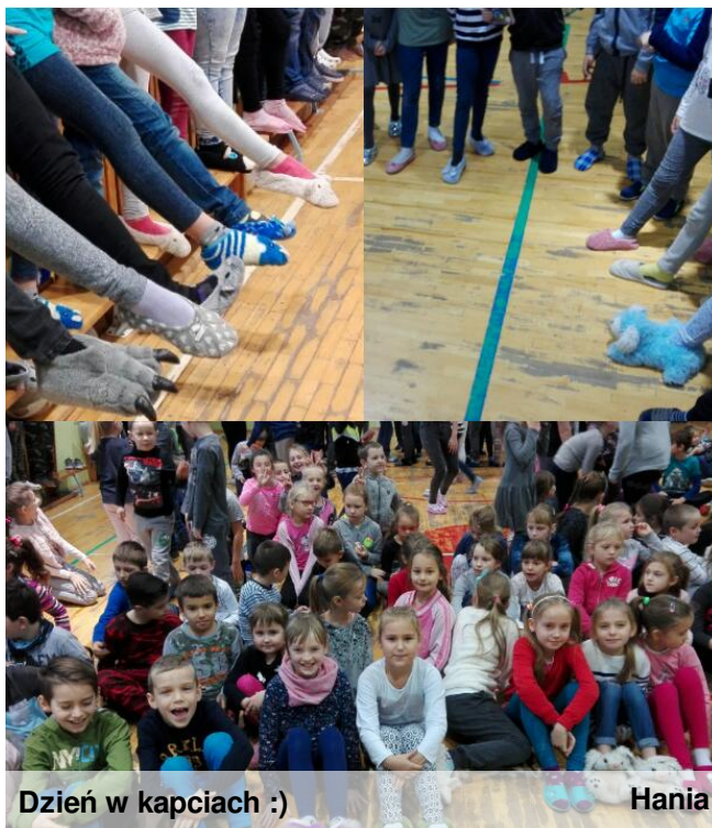
Dzień w kapciach :)

17.11 w czwartek odbył się Szkolny Dzień Kapci. Klasy I-VI prezentowały swoje kapcie na sali gimnastycznej. Sam pomysł powstał na zebraniu samorządu szkolnego MiDSU.