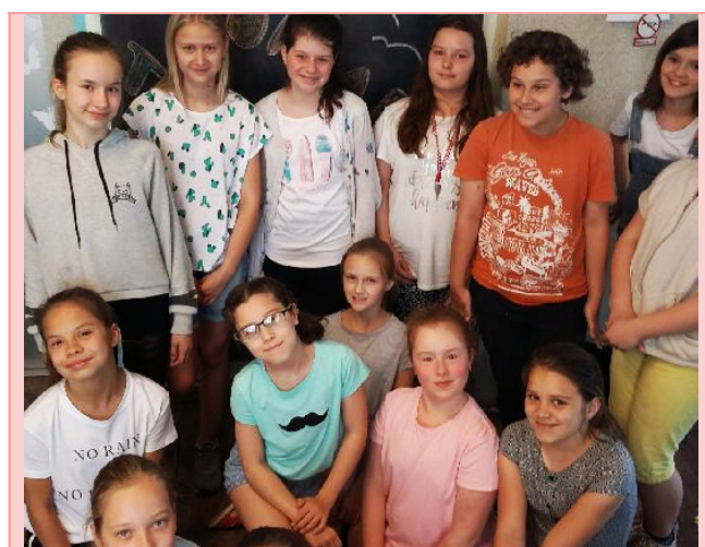
TWÓRCZE OPOWIADANIE KL. V