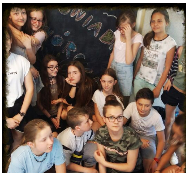
TWÓRCZE OPOWIADANIE KL. VI