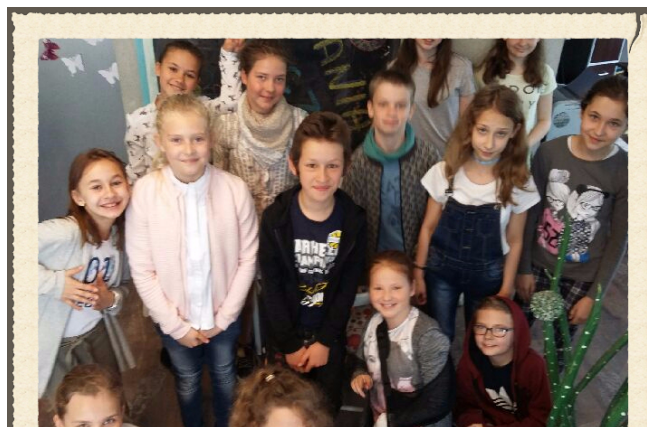
TWÓRCZE OPOWIADANIE KL. IV