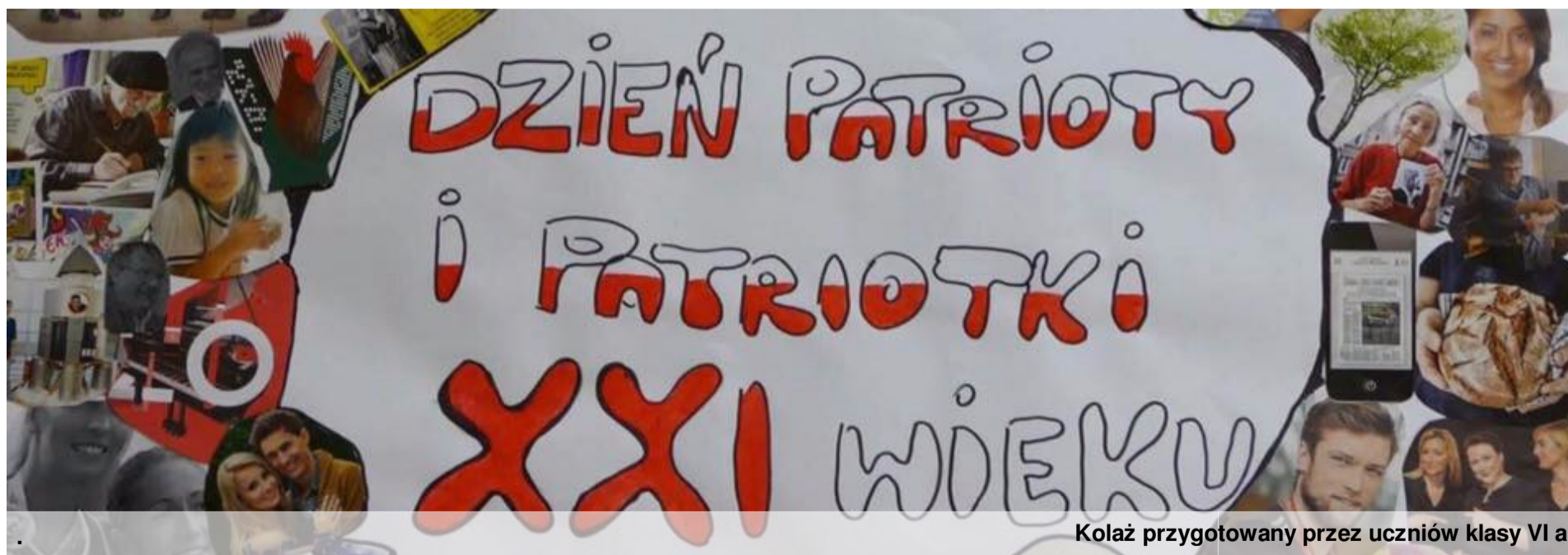
Kolaż przygotowany przez uczniów klasy VI a