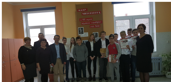
Zwycięzcy i zaproszeni goście.