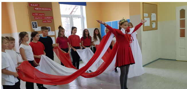
Występ naszych uczniów.