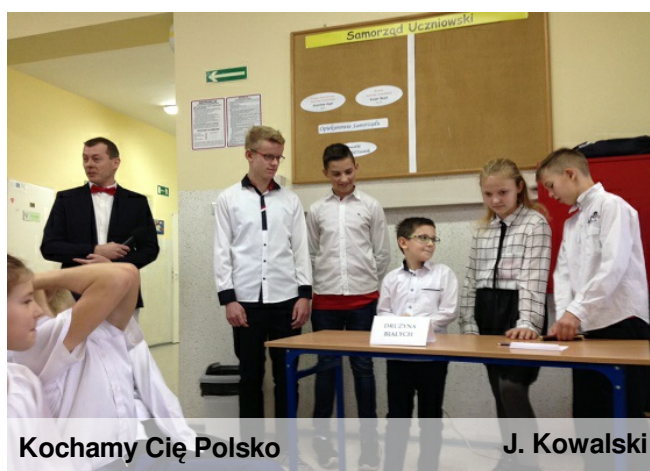
Kochamy Cię Polsko