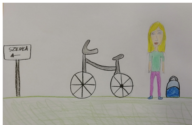
Rowerem do szkoły!