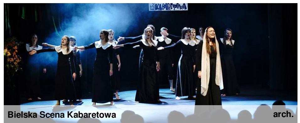
Bielska Scena Kabaretowa

O.Ł: Niestety nie ma na to recepty, ponieważ to sprawa bardzo indywidualna. Szczególnie w dzisiejszym świecie otoczonym milionami możliwości m.in. talent show, przez które słowo „artysta” stało się bardzo ogólnym pojęciem i czasem nawet pochopnie i nad wyraz wykorzystywane. Z drugiej strony wydaje mi się, że takim prawdziwym Artystą przez duże A się nie ZOSTAJE, tylko po prostu się Nim JEST. Tylko owoce tego są widoczne dopiero w późniejszym czasie – po przebytej długiej drodze ciężkiej pracy z odpowiednim bagażem doświadczeń. Dlatego, żeby za bardzo nie tworzyć tu niepotrzebnego elaboratu na pytanie „JAK zostać artystą?” odpowiem krótko: „SKUTECZNIE” ;)