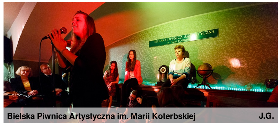
Bielska Piwnica Artystyczna im. Marii Koterbskiej