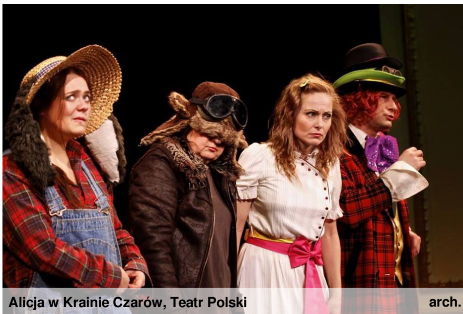
Alicja w Krainie Czarów, Teatr Polski

Samo przygotowanie to nie tylko nauka tekstu, lecz przede wszystkim utożsamienie się z daną postacią, przyjęcie na siebie jego cech charakteru, sposobu wyrażania poprzez odpowiednie ruchy, intonację głosu, gesty. I co najtrudniejsze przygotować się tak, aby zaciekawić sobą widza i być w tym wszystkim naturalnym, prawdziwym. Dlatego potrzebne jest tak wiele godzin, dni, tygodni, a czasem i miesięcy spędzonych na próbach. W tym spektaklu ważną rolę przy przygotowaniach pełnił również dystans mój do samej siebie oraz świadomość swoich możliwości, tak aby móc jak najbardziej naturalnie odtworzyć „głupkowatego” Szaraka czy też „roztrzępanego” Ptaka Dodo.