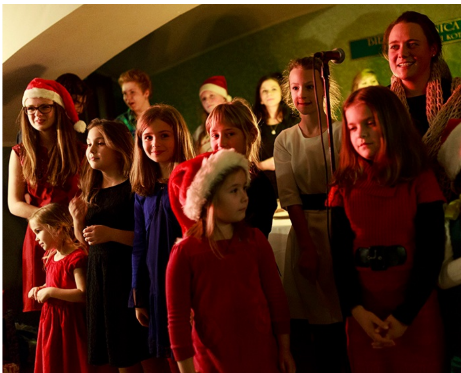
Bielska Piwnica Artystyczna im. Marii Koterbskiej

Przede wszystkim w dzieciach jest wiele spontaniczności, naturalności i takiej czystej radości bawienia się w teatr, co uważam za bezcenne. Nie są jeszcze na tym etapie zmanierowania czy też zablokowania przez schematy i ogólnie przyjęte normy. Piękne jest też to, że dzieciaki chłoną całą tę naukę tak szybko jak gąbka, równocześnie stając się tym samym bardziej świadomym i otwartym, pomysłowym i kreatywnym. A poza tym, dla kogoś tak młodego jak ja, to sama przyjemność dzielić się swoją pasją, przekazywać dalej swoje zdobyte doświadczenie i zarażać innych tym co piękne oraz wartościowe.