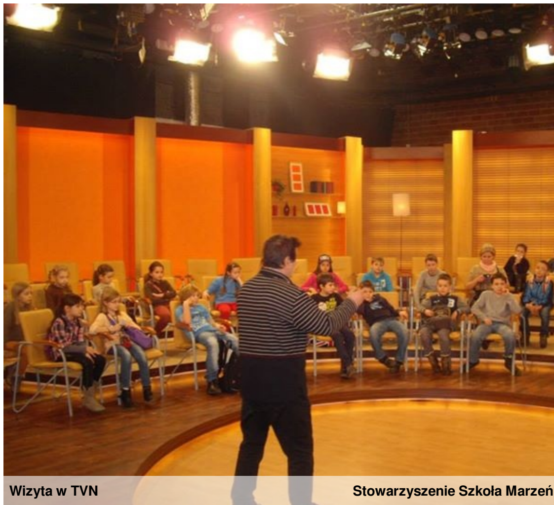
Wizyta w TVN