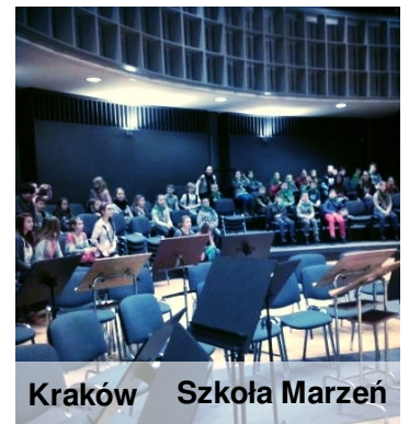
Kraków Szkoła Marzeń