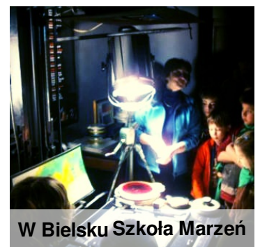
W Bielsku Szkoła Marzeń

Uczniowie poznali tradycyjne i nowoczesne techniki tworzenia bajek dla dzieci. Dowiedzieli się jak narysowaną postać wprawić w ruch i przenieść na ekran telewizorów i kin. Operując refleksami świetlnymi, tworzyli nastrój