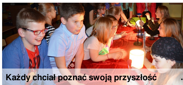
Każdy chciał poznać swoją przyszłość