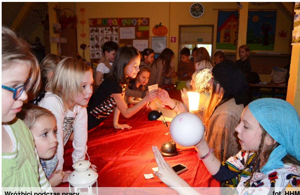
Wróżbici podczas pracy