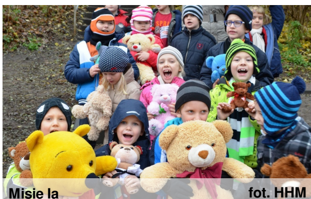
Misie Ia