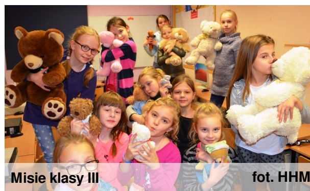
Misie klasy III

Przepis na ciasteczka mojej babci, które zawsze się udają i są przepyszne.