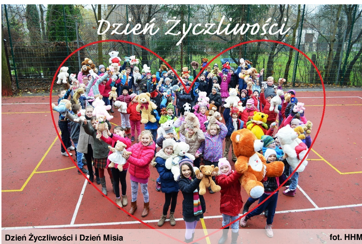
Dzień Życzliwości i Dzień Misia