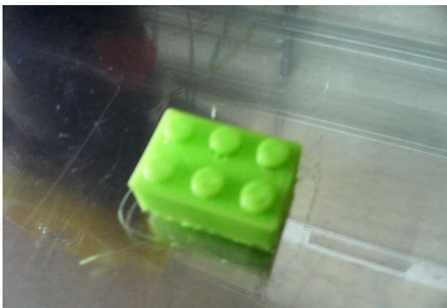
Kłoczek lego wydrukowany na drukarce 3D.

Kółko 3D w każdą środę (nie licząc tych wolnych) od godz. 15.25 do 16.10.