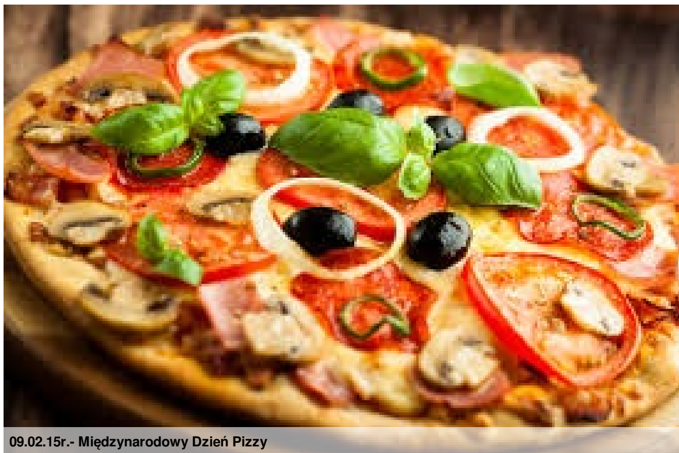
09.02.15r.- Międzynarodowy Dzień Pizzy